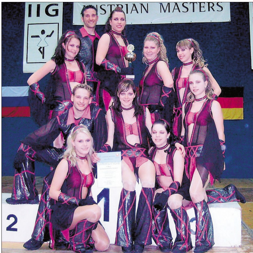
Meisterhaft auch auf internationalem Parkett: Die Silbania aus Altmannstein gewann am Sonntag in der österreichischen Hauptstadt Wien die „Austrian Masters“.